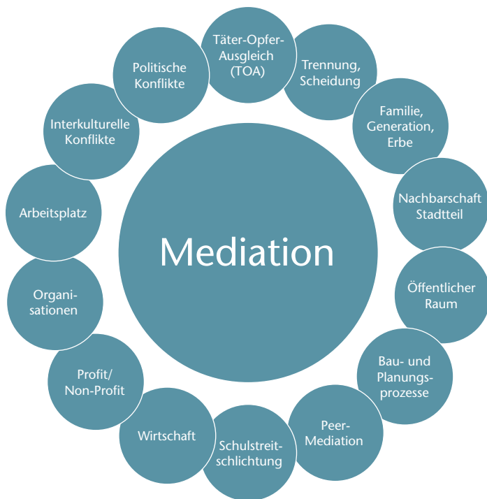
Abb. 3: Anwendungsbereiche der Mediation

Die Mediation findet in vielen sehr unterschiedlichen Anwendungskontexten ihren Einsatz (siehe Abb. 3). Im Anwendungsbereich Schule, Nachbarschaft, in interkulturellen Kontexten, im öffentlichen Raum und auch im strafrechtlichen Kontext (Täter-Opfer-Ausgleich) finden mit dem Verfahren der Mediation hilfreiche Interventionen für einen gelingenden Umgang mit Konflikten statt. Besonders verbreitet ist die Anwendung der Mediation im Zusammenhang familiärer Konflikte (Paare, Familie, Erbschaft, Trennung und Scheidung) sowie bei Konflikten im Bereich Arbeit und Wirtschaft (siehe auch den Beitrag von Beate Storner in dieser Ausgabe). In der Regel findet die Mediation hier als Intervention bei einem bereits eskalierten Konflikt statt. Neu etabliert sich in bestimmten Anwendungskontexten die Medi-